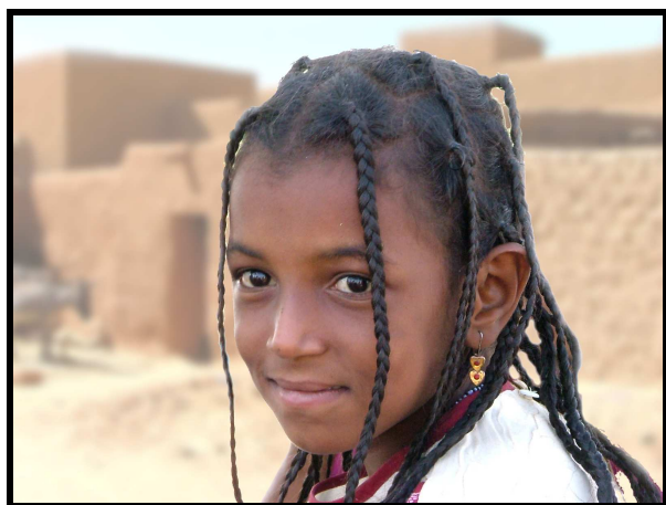
Avec le sourire de Khadidja...

Petite annonce : nous recherchons pour le Niger un ordinateur portable en bon état de fonctionnement. S'adresser au 02 99 47.07.05